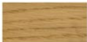
DĄB EUROPEJSKI / EUROPEAN OAK EUROPÄISCHE EICHE / ДУБ