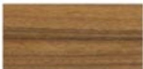
MUTENYE / MUTENYE / MUTENYE / МУТЕНИЯ