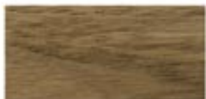
ORZECH EUROPEJSKI / EUROPEAN WALNUT EUROPÄISCHE WALNUS / ОРЕХ ЕВРОПЕЙСКИЙ