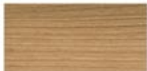
CZEREŚNIA EUROPEJSKA / EUROPEAN CHERRY EUROPÄISCHE KIRSCH / ЧЕРЕШНЯ ЕВРОПЕЙСКАЯ