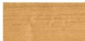
IROKO / IROKO / IROKO / ИРОКО