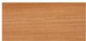
DOUSSIE / DOUSSIE / DOUSSIE / ДУССИЕ