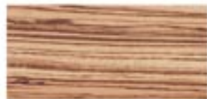
ZEBRANO / ZEBRANO / ZEBRANO / ЗЕБРАНО