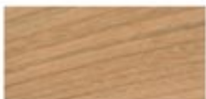
CZEREŚNIA AMERYKAŃSKA / AMERICAN CHERRY AMERIKANISCHE KIRSCH / ЧЕРЕШНЯ АМЕРИКАНСКАЯ