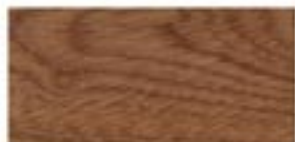
SAPELLI / SAPELE / SAPELI / САПЕЛЕ