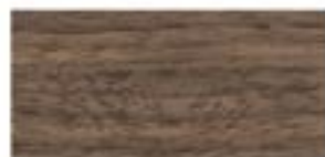
ORZECH AMERYKAŃSKI / AMERICAN WALNUT AMERIKANISCHE NUS / ОРЕХ АМЕРИКАНСКИЙ