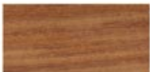
TALI / TALI / TALI / ТАЛИ