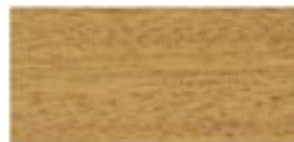
DIBETOU / DIBETOU / DIBETOU / ДИБЕТУ