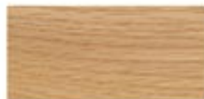
DĄB CZERWONY / RED OAK ROTE EICHE / ДУБ КРАСНЫЙ