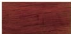
PADOUK / PADOUK / PADOUK / ПАДУК