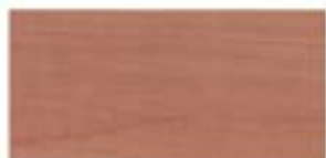
GRUSZA / PEARWOOD / BIRNE / ГРУША