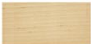
BUK / BEECH / BUCHE / БУК