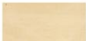
KLON KANADYJSKI / CANADIAN MAPLE KANADISCHES AHORN / КЛЁН КАНАДСКИЙ