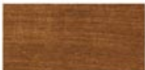
SUCUPIRA / SUCUPIRA / SUCUPIRA / СУКУПИРА