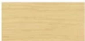
SOSNA / PINE / FÖHRE / СОСНА