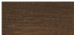
IPE / IPE / ИП