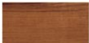
TEAK / TEAK / TEAK / ТИК