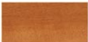
BADI / BADI / BADI / БАДИ