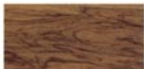
BUBINGA / BUBINGA / BUBINGA / БУБИНГО