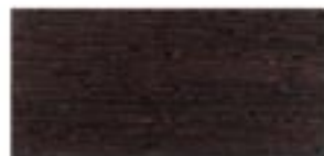
WENGE / WENGE / WENGE / ВЕНГЕ