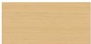
BRZOZA / BIRCH / BIRKE / БЕРЕЗА