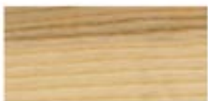
JESION TWARDZIELOWY / BROWN ASH BRAUNE ESCH / ЯСЕНЬ