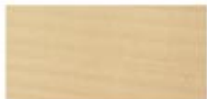
KLON / COMMON MAPLE / AHORN / КЛЁН