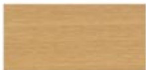
ANEGRE JASNA / LIGHT ANEGRE / ANEGRE LICHT / АНЕГРИ