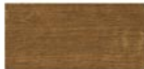
MAKORE / MAKORE / MAKORE / МАКОРЕ