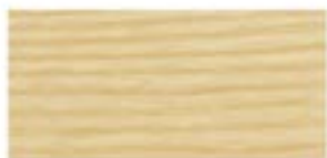
JESION BIELASTY / WHITE ASH WEISSE ESCH / ЯСЕНЬ БЕЛЫЙ