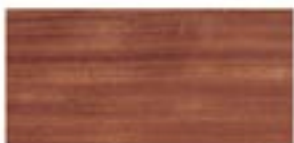
GOMBE / GOMBE / GOMBE / ГОМБЕ