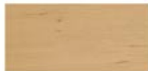
OLCHA / ALDER / ERLE / ОЛЬХА