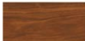
PALISANDER SANTOS / PALISANDER SANTOS / PALISANDER SANTOS / ПАЛИСАНДР