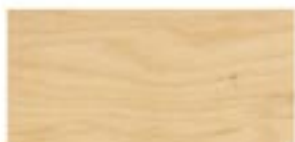
BRZOZA SKANDYNAWSKA / SCANDINAVIAN BIRCH SKANDINAVISCH / БЕРЕЗА СКАНДИНАВСКАЯ