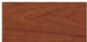
JATOVE / JATOVE / JATOVE / ЯТОБА